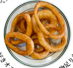
みんな大好きオニオンリング★少し物足りない時にも