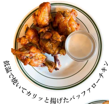
低温で焼いてカリッと揚げたバッファローチキン

★ カーリーフライ CURLY FRIES (S) 450yen (税込495yen) (M) 750yen (税込825yen) (L) 1,000yen (税込1,100yen)