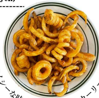
スパイシーな味付けがクセになるカーリーフライ