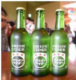
ORION CIDER 沖縄の定番 ORION BEERが作る 爽やかな口当たりが人気のサイダーです