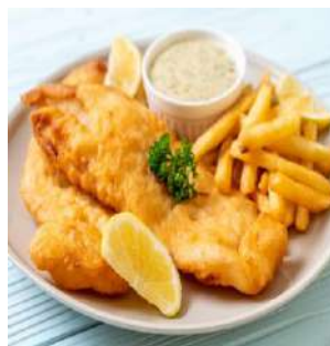
FISH&CHIPS イギリスを代表する白身魚のフライ 自家製タルタルソースと相性抜群です