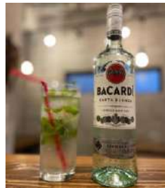
自家製生ミントたっぷりモヒート ・ MOJITO ・ MANGO / ・ PINEAPPLE