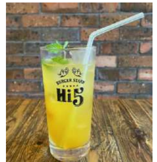
マンゴーソーダ マンゴーの果肉にライムと生ミントが 加わり南国沖縄で人気のDrinkです