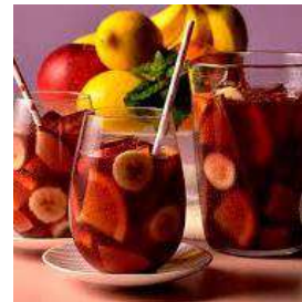
南国フルーツの香りと酸味 心地よい甘さのサングリア Ask the staff