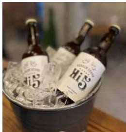
Hi-Five ORIGINAL CRAFT BEER 季節によって味を変えています 詳しくはSTAFFまで